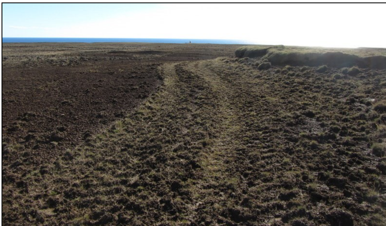
Mynd 1. Sáð hefur verið grasfræi og borinn á tilbúinn áburður meðfram rofabarðinu, nauðsynlegt er að fylgja aðgerðum eftir með áburðargjöf. Krýsuvíkuviti er fyrir miðri mynd.

Þann 9. og 10. júní dreifði Landgræðslan 15 tonnum af tilbúnum áburði á 83 ha lands. Megin áhersla var lögð á aðgerðir á svæðum ofan Krýsuvíkurbjargs, sjá meðfylgjandi kort. Við val á svæðum var stuðst við kortlagningu ársins 2013 og skoðunarferðir starfsmanna Landgræðslunnar. Heildarkostnaður við uppgræðsluna var um 1,9 mkr.